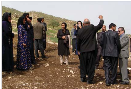
بازدید میدانی مسئولین دست اندرکار بخشداری، بهداشت، کشاورزی، آبخیزداری و خدمات منطقه جلاوند.