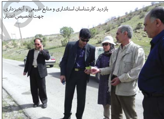
بازدید کارشناسان استانداری و منابع طبیعی و آبخیزداری، جهت تخصیص اعتبار.