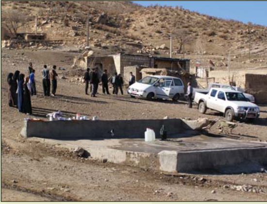
بازدید کارشناسان جهاد کشاورزی.